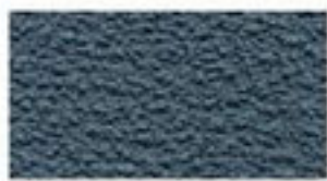
Résilient gris rugueux