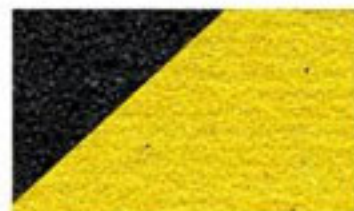
Avertissement de danger formable