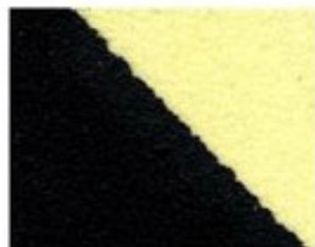
Phosphorescent d'avertissement de danger

Procure une capacité photoluminescente, peut être rechargée par des sources naturelles ou artificielles.