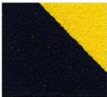
Avertissement de danger noir/jaune