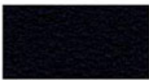
Résilient noir rugueux