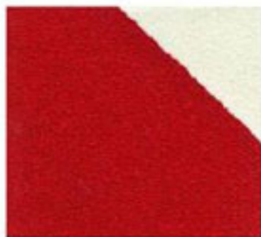
Avertissement de danger rouge/blanc